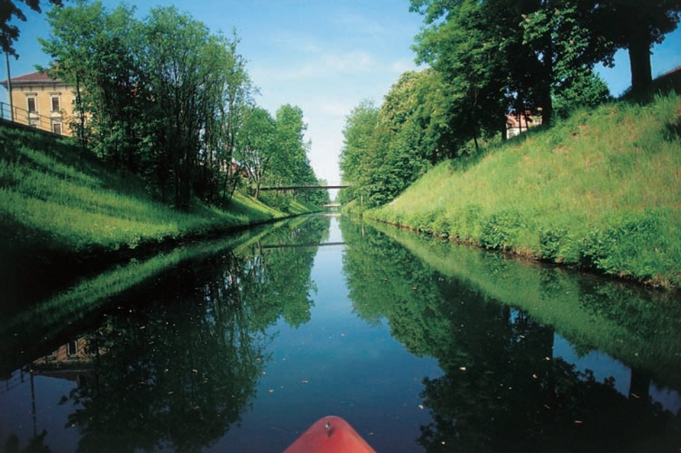
Lendkanal – eine Naherholungsoase für die Klagenfurter Einst berühmt durch die Bleischrotgewinnung – der Schroturm